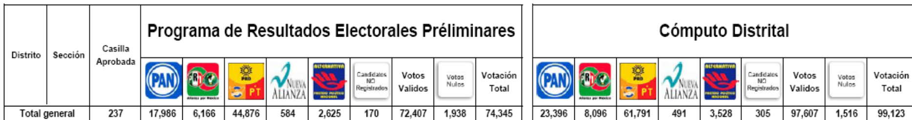
Análisis Paquetes Electorales Abiertos durante el Cómputo Distrital de la elección de Presidente de los Estados Unidos Mexicanos de 2006 por casilla

De esta votación, el PAN obtuvo 5,410 votos, la APM 1,930 y la APBT 16,915 votos.