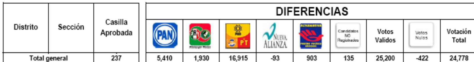
Análisis Paquetes Electorales Abiertos durante el Cómputo Distrital de la elección de Presidente de los Estados Unidos Mexicanos de 2006 por casilla

De esta votación, el PAN obtuvo 5,410 votos, la APM 1,930 y la APBT 16,915 votos.