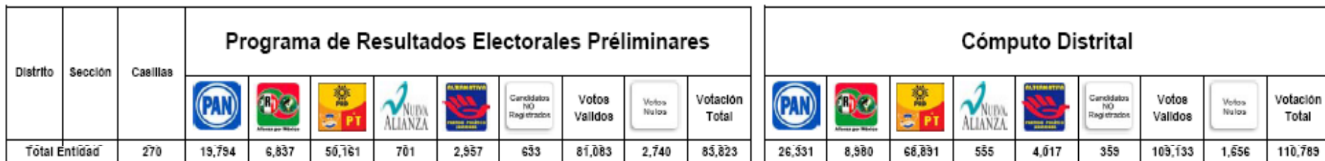
Análisis Paquetes Electorales Abiertos durante el Cómputo Distrital de la elección de Presidente de los Estados Unidos Mexicanos de 2006 por Distrito