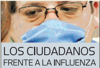
LOS CIUDADANOS FRENTE A LA INFLUENZA